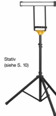
Stativ (siehe S. 10)