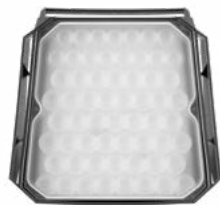
Magnum Multi Battery XS 2300 lm