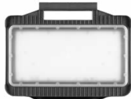
Magnum Multi Battery M 4050 lm