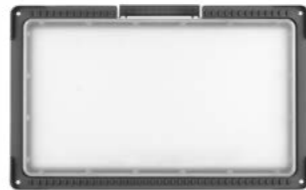
Magnum Multi Battery L 9250 lm